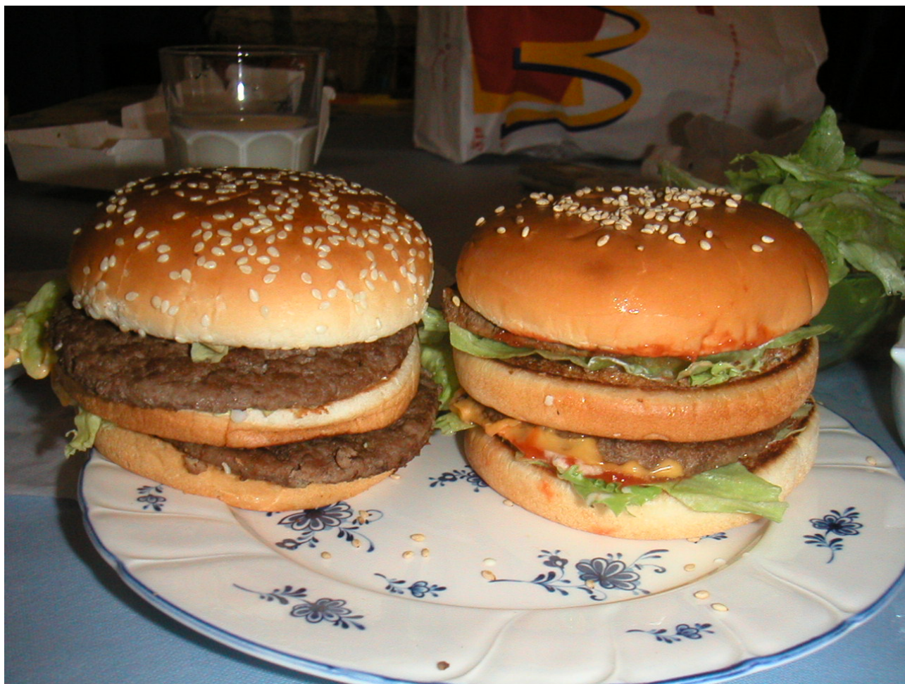
左が本物の Big Mac 右が¥138+ Big Mac